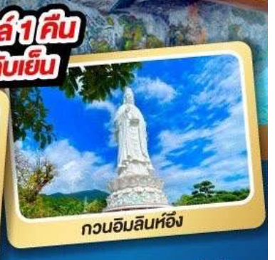
กวนอิมลินห์ฮิ่ง