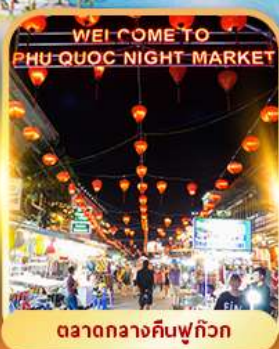
ตลาดกลางคืนฟู๊ควัก