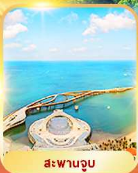
สะพานจวบ