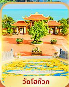
วัดโฮกิวก