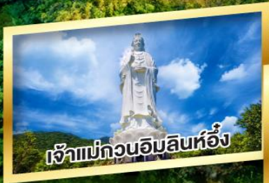
เจ้าแม่กวนอิมสินหื้อง