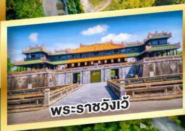
พระราชวังเว็