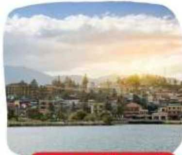
ทะเลสาบเมืองซาปา