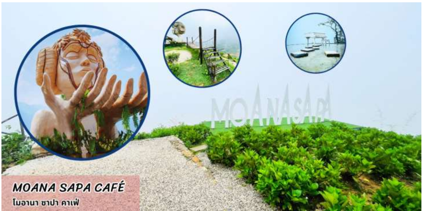
MOANA SAPA CAFÉ โมอานา ซาปา คาเฟ่

นำท่านเช็คอินแลนด์มาร์คแห่งใหม่ของซาปา โมอาน่า ซาปา คาเฟ่ (MOANA SAPA CAFÉ) จำลองไฮไลท์ของที่เที่ยวดังแต่ที่มารวมไว้ให้ท่านได้ถ่ายรูปท่ามกลางบรรยากาศที่โอบล้อมไปด้วยภูเขา ให้ท่านอิสระเลือกซื้อเครื่องดื่ม และเพลิดเพลินกับสายหมอกจางๆ พร้อมกับบรรยากาศสุดฟิน อิสระให้ถ่ายภาพตามอัธยาศัย