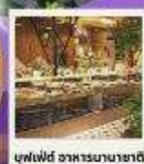
บุฟเฟ่ต์ อาหารนานาชาติ