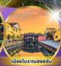
เมืองโบราณฮอยอัน