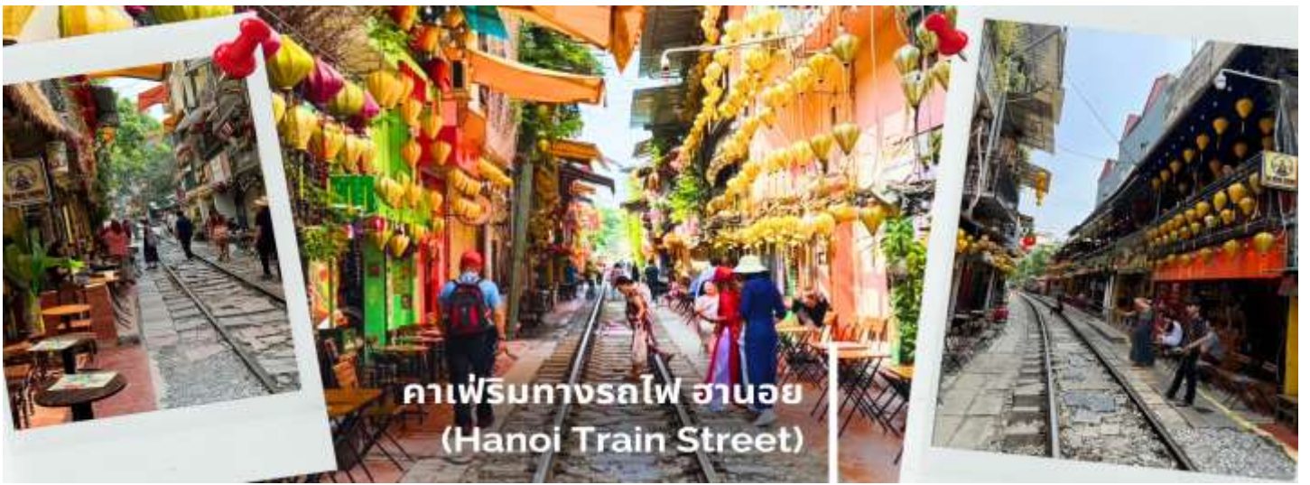
คาเฟ่ริมทางรถไฟ ฮานอย (Hanoi Train Street)