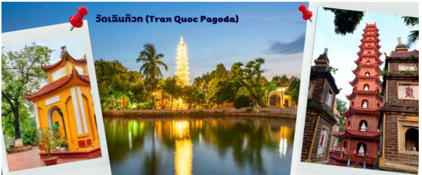
วัดเจดินก๊วก (Tran Quoc Pagoda)

สมควรแก่เวลา นำท่านเดินทาง สู่ท่าอากาศยานนานาชาติฮานอย เตรียมตัวเดินทางสู่กรุงเทพฯ