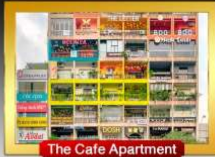
The Cafe Apartment