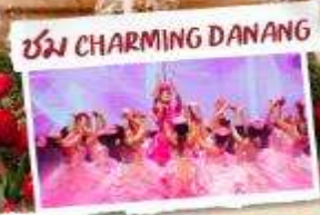
ชม CHARMING DANANG