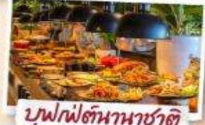
บุฟเฟ่ต์นานาชาติ