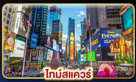
ไทม์สแควร์