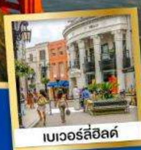
เบเวอร์ลี่ฮิลล์