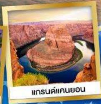
แกรนด์แคนยอน