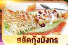
สลัดกุ้งมังกร