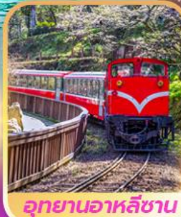
อุทยานอาหลีซาน