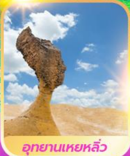
อุทยานเหยหลิว