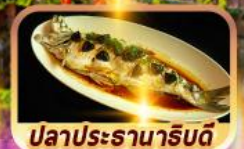
ปลาประจานาธิบดี