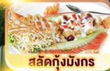
สลัดกุ้งมังกร