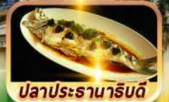
ปลาประจานารับดี