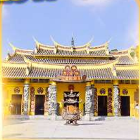
วัดซอพรเทพเจ้า