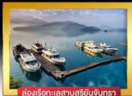
ส่องเรือทะเลสาบสุริยันจันทรา