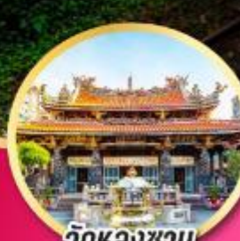
วัดหลงชาม