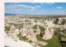
หุบเขาเทพเรนท์

** พักที่ Dedeli Cave Hotel 5* หรือเทียบเท่า **