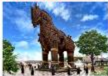
เมืองชานัคคาเล่

** พักที่ Buyuk Truva Hotel 4* หรือเทียบเท่า **