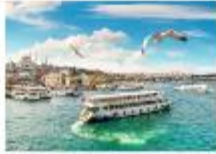
ล่องเรือช่องแคบบอสฟอรัส

04.00 น. พร้อมกัน ณ อาคารผู้โดยสารขาออกระหว่างประเทศ เคาน์เตอร์เช็คอินสายการบิน Turkish Airlines 06.45 น. ออกเดินทางสู่นครอิสตันบูล ประเทศตุรกี เที่ยวบิน TK59 13.00 น. เดินทางถึงสนามบินอิสตันบูล