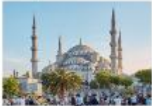
สุเหร่าสีน้ำเงิน