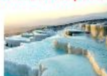
เมืองปามุคคาเล่

** พักที่ Richmond Thermal Hotel 5* หรือเทียบเท่า **