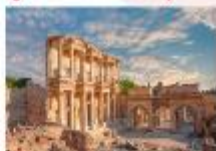
เมืองเอเฟซุส

** พักที่ Le Blue Hotel 5* หรือเทียบเท่า **