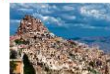
เมืองบูซาร์