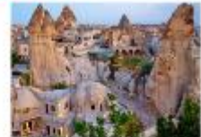
เมืองคัปปาโดเกีย

** พักที่ Under Cave Hotel 5* หรือเทียบเท่า **