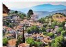
หมู่บ้านออตโตมัน