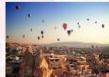
เมืองคัปปาโดเกีย