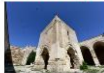
คาราวานสไรน์

หมายเหตุ เดือน ก.ค ท่านสามารถชมสวนเซอร์รี เดือน ส.ค. ชมทุ่งอาเวนเตอร์ ทั้ง 2 รายการนี้ ขึ้นอยู่กับสภาพอากาศ