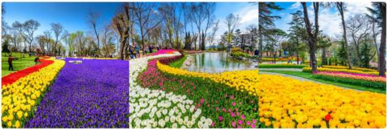
*ภาพเพื่อการโฆษณาเท่านั้น

สวนดอกทิวลิปหลากสีหลายสายพันธุ์นับล้านดอกที่สวยงามที่สุด และมีชื่อเสียงที่สุดของตุรกี ตลอดเดือนเมษายน เทศกาลทิวลิปอิสตันบูล เป็นเทศกาลประจำปี โดยจะจัดในช่วง 3 สัปดาห์สุดท้ายของเดือนเมษายน เพื่อเฉลิมฉลอง ทั้งฤดูใบไม้ผลิ และความสำคัญของดอกทิวลิป ที่มีต่ออาณาจักรออตโตมัน และวัฒนธรรมตุรกี ปกติแล้วเทศกาลนี้ จัดขึ้นที่สวนสาธารณะ ที่มีชื่อเสียงที่สุดของเมือง ให้ทุกท่านได้ถ่ายรูปตามอัธยาศัย