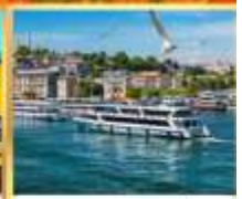
เรือเฟอร์รี่