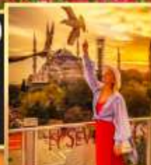
ลู่ฟือปเซเวนฮิลล์ส