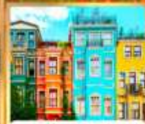
บ้านหลากสี คิสเลอร์ฟู