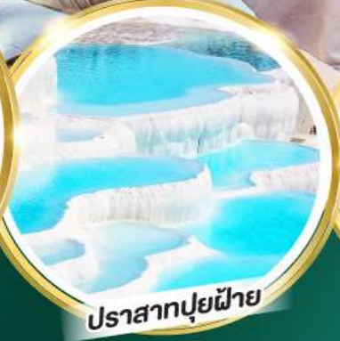
ปราสาทปูนฝ้าย