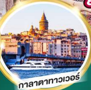
กาลาตาทาวเวอร์