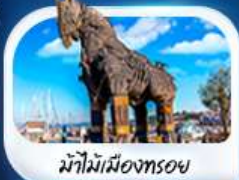
ม้าไม้เมืองทรอย

พิเศษ! ส่งเรือชมความสวยงามช่องแคบ 2 ทวีป "ช่องแคบบอสฟอรัส"