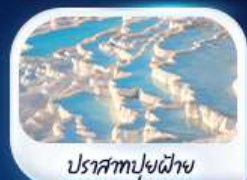
ปราสาทปุยฝ้าย

6-14 ก.พ.68 / 20-28 ก.พ.68 / 11-19 มี.ค.68