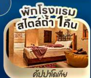
พักโรงแรม สไตล์ดี 1 คืน