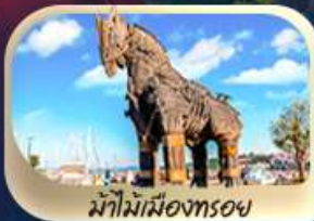
ม้าไม้เมืองทรอย