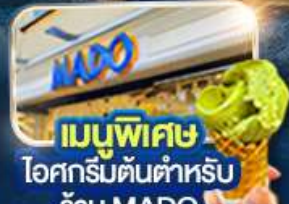
เมนูพิเศษ ไอศกรีมต้นตำหรับ ร้าน MADO