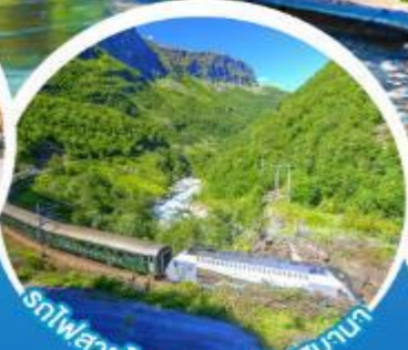
รถไฟสายโรแมนติกฟลัมส์บานา