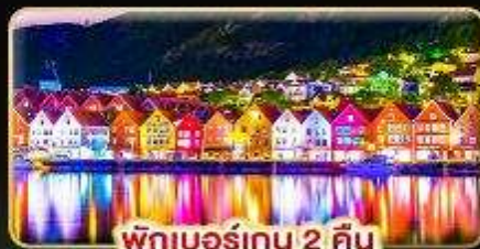
พักเบอร์เกน 2 คืน