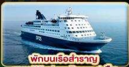
พักผ่อนเรือสำราญ แบบ Window Room 1 คืน