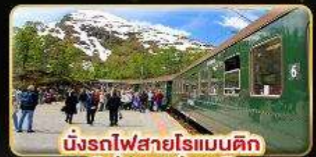
นั่งรถไฟสายโรแมนติก "ฟรอมสปาน่า"