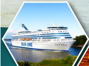
เรือสำราญ TALLINK SILJA LINE