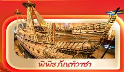
พิพิธภัณฑ์ท้าวชา