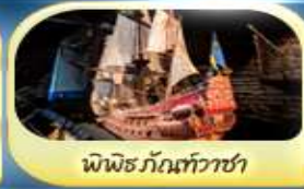
พิพิธภัณฑ์ทิวาชา