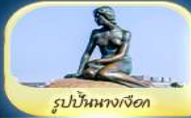
รูปปั้นนางเงือก