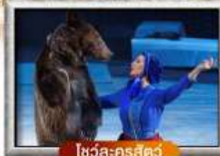
โซว์ละครสัตว์