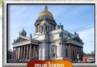
เซนต์ไอแซค