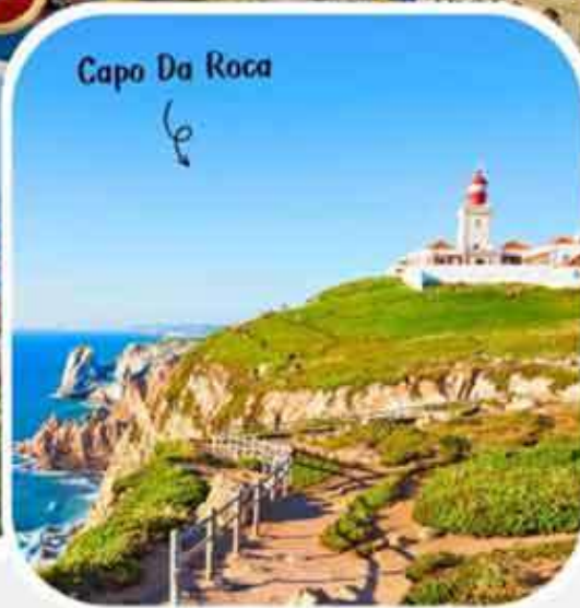
Capo Da Roca