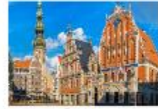
เมืองริกา

** พักที่ Bellevue Park Hotel Riga 4* หรือเทียบเท่า **