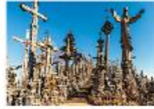
Hill of Crosses