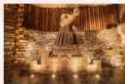
เหมืองเกลือวิลิชก้า