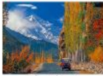
เมืองชิลาส

** พักที่ Shangrila Chilas Hotel หรือเทียบเท่า **