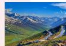
หุบเขา Naran Kaghan

** พักที่ Besham Hilton Hotel หรือเทียบเท่า **