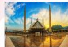
มัสยิดไฟซาล

DAY8 ตักศิลา-พิพิธภัณฑ์ตักศิลา-อิสลามาบัด-มัสยิดไฟซาล-Shopping-กรุงเทพ