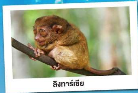
ลิงทาร์เซีย