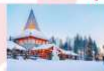
หมู่บ้านซานต้าครอส

15.25 น. ออกเดินทางสู่อิสตันบูล ประเทศตุรกี เที่ยวบินที่ TK 1750 21.10 น. เดินทางถึงสนามบินอิสตันบูล (แวะเปลี่ยนเครื่อง)