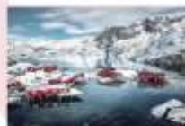
หมู่บ้าน Nusfjord

** พักที่ ELIASSEN RORBUER OR SIMILAR **