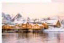
หมู่บ้าน Sakrisoy