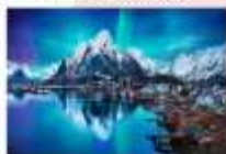
หมู่เกาะโลโฟเทน

00.00 น. ออกเดินทางสู่ เมืองเลกเนส โดยสายการบิน Scandinavian Airlines เที่ยวบินที่ SK 4106 แวะเปลี่ยนเครื่องที่เมือง Bodo เป็นสายการบิน Wide roe WF 810 00.00 น. เดินทางถึงสนามบินเมืองเลกเนส