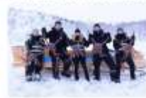
สนุกกับกิจกรรมจับปุยักษ์

00.00 น. ออกเดินทางสู่ เมืองคีร์กเคนเนส โดยสายการบิน...เที่ยวบินที่... 00.00 น. เดินทางถึงสนามบินเมืองคีร์กเคนเนส