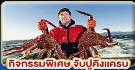
กิจกรรมพิเศษ จับปูคิงแครม