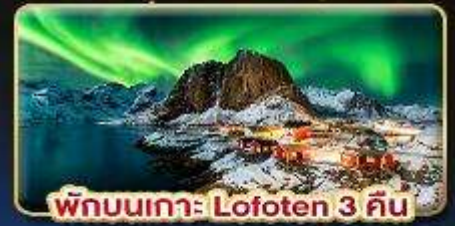
พิกนเกาะ Lofoten 3 คืน