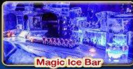
Magic Ice Bar