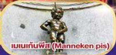
แมนเนกันพีส (Manneken pis)