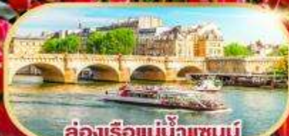
ล่องเรือแม่น้ำแซนน์