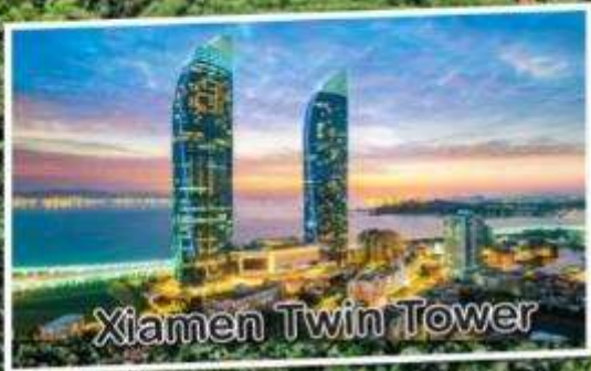
Xiamen Twin Tower