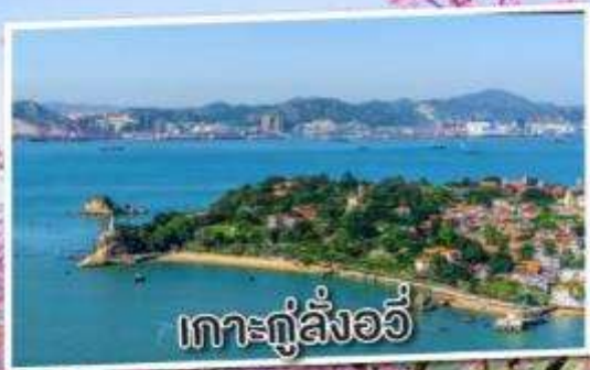
เกาะกู่ลิ่งอวี่

เยือนมรดกโลกบ้านดิน ชมซากุระแห่งฝูเจี้ยน 1 ปี มีครั้งเดียว