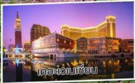
เดอะเวเนเซียน