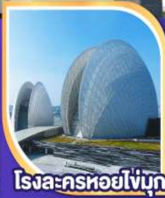
โรงละครหอยโข่งบุก