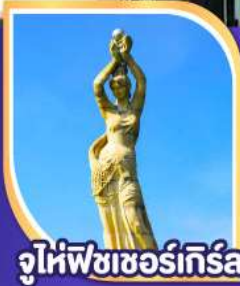
จูไห่พีซเซอร์เกิร์ล