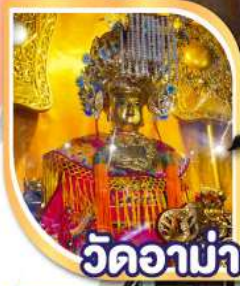
วัดอาน่า