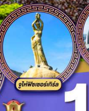
จูให้พิชชองีร์รา