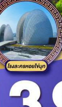
โรงแคชอยไ้ญุ่