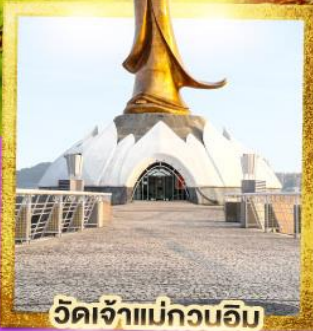
วัดเจ้าแม่กวนอิม

เดินทาง 20-22 ก.ย. 67 13-15, 18-20 ต.ค. 67 22-24, 25-27 ต.ค. 67 29 พ.ย.-01 ธ.ค. 67