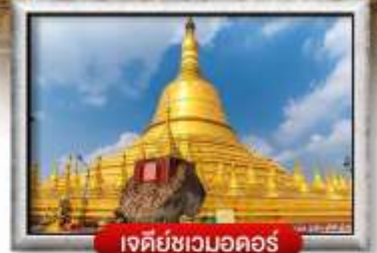
เจดีย์ชเวมอดอร์

เมนู สุดพิเศษ | กุ้งแม่น้ำเผา + บุฟเฟ่ต์นานาชาติ