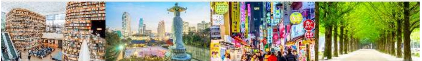
STARFIELD COEX MALL