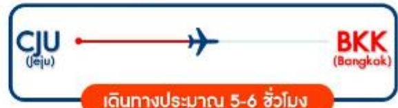
JEJU GOLD PACKAGE NOV 5วัน 3คืน