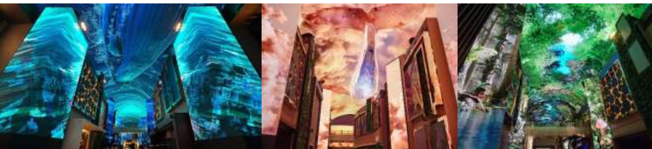
พาทุกท่าน

อาหารกลางวันพร้อมเสิร์ฟด้วยเมนู จิมดัก หรือไก่ตุ๋นซอสดำ เป็นเมนูที่โด่งดังไปถึงเมืองไทยเป็นที่เรียบริ่บร้อยที่นี่ทุกท่านจะได้ทานรสชาติแบบออริจินอล ที่เนื้อไก่จะนุ่มมาก เข้ากันกับซอสที่กลมกล่อม หวานหน้อยๆจากผักที่ถูกต้องรวมกันนานาชนิด มันฝรั่งที่นุ่มละมุนลิ้น และที่หลายๆคนชอบมากคือวุ้นเส้นที่เหนียวนุ่ม คลุกเคล้ากับน้ำซอสแบบออริจินอล พร้อมกับข้าวสวยร้อนๆ รับรองความอร่อย แบบลิ้มไม่หลง และขาดไม่ได้เครื่องเคียงที่ร้านจะนำเสนอตามฤดูกาล เช่น กิมจิ สาหร่าย ถั่ว ไซเท้าดอง ถั่วงอกดอง เป็นต้น