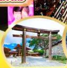
ศาลเจ้าเมจิ