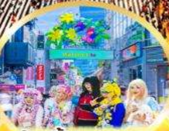
ช้อปปิ้ง ฮาราจูกุ