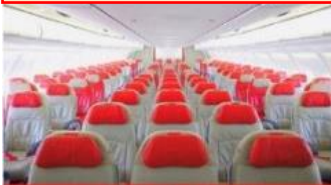
เครื่องบินลำใหญ่ 377 ที่นั่ง

ตัวเครื่องบินเป็นตัวกรู๊ปสำหรับคณะทัวร์ ระบบของสายการบินจะทำการแรนดอมที่นั่ง ซึ่งไม่สามารถล็อกหรือเลือกกระบูกี่นั่งได้ หากลูกค้าต้องการเลือกกระบูกี่นั่ง ทางสายการบินมีบริการอัพเกรดที่นั่ง (ค่าบริการเป็นไปตามที่สายการบินกำหนด)