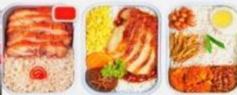
บริการอาหารร้อน ทั้งขาไป-ขากลับ