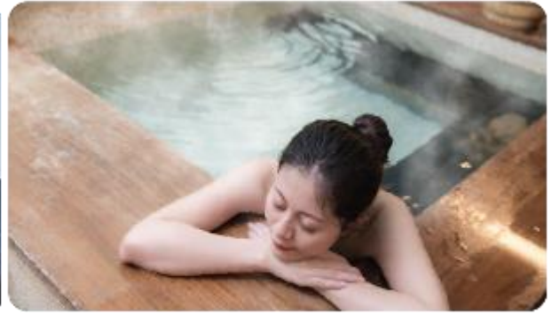
เมืองยามานาชิ | ผ่อนคลายแช่ออนเซ็น

นำพาทุกท่านเข้าสู่โรงแรม อิสระให้ท่านพักผ่อนด้วยการแช่ออนเซ็น เพื่อผ่อนคลายกล้ามเนื้อ ความเหนื่อยล้า จากการเดินทางมาตลอดทั้งวัน