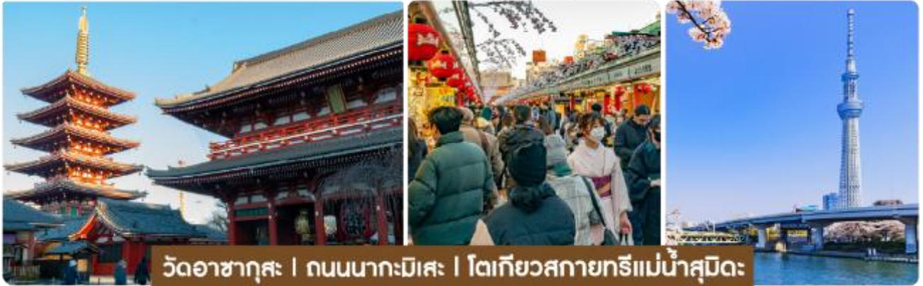
วัดอาซากุสะ | ถนนนาคะมิสะ | โตเกียวสกายทรีแม่น้ำสุมิตะ

กรุงโตเกียว วัดอาซากุสะ วัดอาซากุสะ หรือเซ็นโซจิ เป็นวัดเก่าแก่และมีชื่อเสียงที่สุดในโตเกียวใน ย่านอาซากุสะ ภายในวัดมีรูปปั้นเจ้าแม่กวนอิม รวมถึงเจดีย์ห้าชั้น เมื่อเดินผ่านประตูคามินาริมงที่มีโคมแดงขนาดใหญ่ จะเจอกับ ถนนช้อปปิ้งนาคะมิสะ (NAKAMISE SHOPPING) ถนนช้อปปิ้งที่มีประวัติยาวนานใน ย่านอาซากุสะ และเต็มไปด้วยร้านค้าขายของฝาก ขนมหวาน และสินค้าพื้นเมืองญี่ปุ่น ที่นี่เราสามารถพบกับสินค้าหลากหลายชนิด หากมีเวลาขอพาทุกท่านไปยังจุดชมวิวยุริเมะ แม่น้ำสุมิตะ (SUMIDA RIVER) ที่จะชวนให้เราเห็นวิวของ โตเกียวสกายทรี TOKYO SKY TREE พร้อมวิวทิวทัศน์ที่สวยงาม