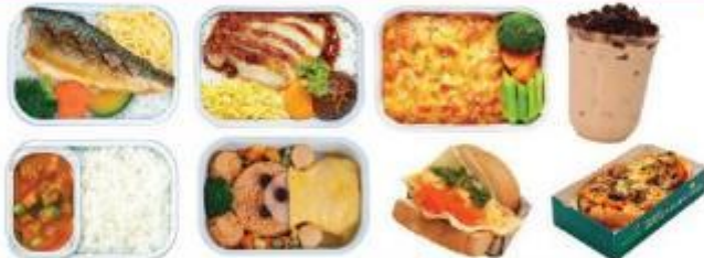
** ภาพบนตัวอย่าง รายการอาหารอาจเปลี่ยนแปลงได้ตามช่วงเวลา