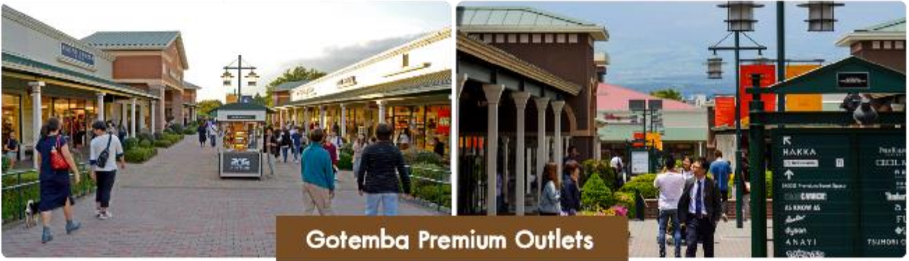
Gotemba Premium Outlets

จากนั้นพาทุกท่านสู่... Gotemba Premium Outlets ห้างเอาท์เลตที่มีขนาดใหญ่ที่สุดในญี่ปุ่น ตั้งอยู่ที่ ฮาโกเน่ จังหวัดคานากาวา ของประเทศญี่ปุ่น เป็นแหล่งช้อปปิ้งที่มีทั้ง แบรินต์ในประเทศและแบรินต์ต่างประเทศ ถ้าอยากหาของอะไรให้มาที่นี่ได้เลย อีกทั้งในบริเวณนี้ ยังเป็นทางผ่านไปเที่ยว ภูเขาไฟฟูจิ และ ทะเลสาบฮาโกเน่ อีกด้วย และยังสามารถมองเห็นภูเขาไฟฟูจิได้จากตรงนี้แบบชัด ๆ ไปเลย คือเดินช้อปปิ้งเราก็จะเห็นจุดพิคกัเอาไว้ชมวิวฟูจิสวย ๆ ไปด้วย เป็นอีกสถานที่ที่อยากให้สายเที่ยว สายช้อปปิ้งได้มาชมวิวและละลายทรัพย์กันอย่างมาจจริง ๆ