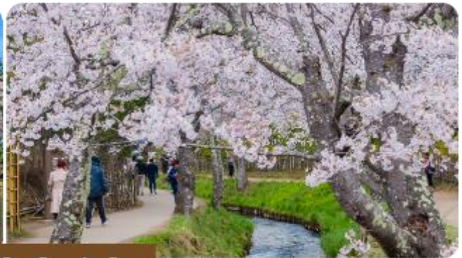
หมู่บ้านน้ำใสโอชิโนะ ฮักไก

โอชิโนะ ฮักไก หรือ ที่รู้จักกันในชื่อ หมู่บ้านน้ำใส ความงามแห่งธรรมชาติและวัฒนธรรมที่ซ่อนอยู่ใต้เงาภูเขาไฟฟูจิ โอชิโนะ ฮักไก ตั้งอยู่ในหมู่บ้านโอชิโนะ จังหวัดยามานาชิ ประเทศญี่ปุ่น เป็นแหล่งน้ำธรรมชาติที่มีชื่อเสียง ประกอบด้วยบ่อน้ำใสสะอาดทั้งแปดแห่ง ซึ่งน้ำในบ่อเหล่านี้เกิดจากการละลายของหิมะและน้ำแข็งจากภูเขาไฟฟูจิ น้ำที่ไหลลงมานั้นได้ถูกกรองผ่านชั้นหินภูเขาไฟเป็นเวลาหลายปี จนทำให้น้ำในบ่อมีความบริสุทธิ์และใสจนเห็นถึงก้นบ่อ ไม่เพียงแต่ความงามของธรรมชาติที่ทำให้โอชิโนะ ฮักไกเป็นที่รู้จัก แต่ยังมีวัฒนธรรมและประวัติศาสตร์ท้องถิ่นอย่างลึกซึ้ง หมู่บ้านนี้เป็นสถานที่ที่เราสามารถสัมผัสกับบรรยากาศที่เงียบสงบและงดงามของธรรมชาติ พร้อมกับเรียนรู้เรื่องราวและวิถีชีวิตดั้งเดิม สัมผัสวัฒนธรรมญี่ปุ่นที่แท้จริง