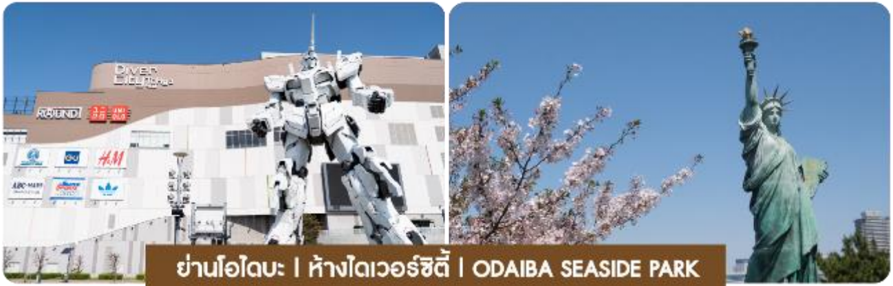
ย่านโอไดบะ | ห้างไดเวอร์ซิตี | ODAIBA SEASIDE PARK

จากนั้นพาไปยัง ย่านโอไดบะ เยือนศูนย์การค้าย่านดังอย่าง DIVERCITY TOKYO PLAZA ที่คุณจะได้พบกับ หุ่นยนต์กันดั้มบังคับขนาดยักษ์ไปจนถึงสินค้าที่หลากหลาย ทั้งนี้ยังเพลิดเพลินกับทิวทัศน์ที่สวยงามของสะพาน Rainbow Bridge และวิวของอ่าวโตเกียวจาก ODAIBA SEASIDE PARK และที่นี้ยังมี TOKYO JOYPOLIS สวนสนุกที่จะพาทุกคนเพลิดเพลิน