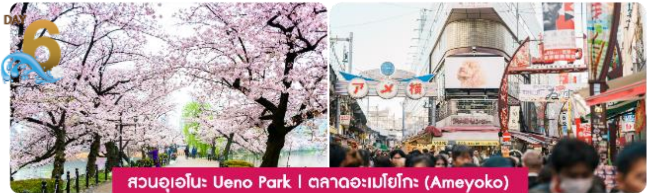
สวนอุเอโนะ Ueno Park | ตลาดอะเมโยโกะ (Ameyoko)

กรุงโตเกียว วัดอาซากุสะ วัดอาซากุสะ หรือเซ็นโซจิ เป็นวัดเก่าแก่และมีชื่อเสียงที่สุดในโตเกียวใน ย่านอาซากุสะ ภายในวัดมีรูปปั้นเจ้าแม่กวนอิม รวมถึงเจดีย์ห้าชั้น เมื่อเดินผ่านประตูคามินาริมงที่มีโคมแดงขนาดใหญ่ จะเจอกับ ถนนช้อปปิ้งนาคะมิสะ (NAKAMISE SHOPPING) ถนนช้อปปิ้งที่มีประวัติยาวนานใน ย่านอาซากุสะ และเต็มไปด้วยร้านค้าขายของฝาก ขนมหวาน และสินค้าพื้นเมืองญี่ปุ่น ที่นี่เราสามารถพบกับสินค้าหลากหลายชนิด หากมีเวลาขอพาทุกท่านไปยังจุดชมวิวยุริเมะ แม่น้ำสุมิตะ (SUMIDA RIVER) ที่จะชวนให้เราเห็นวิวของ โตเกียวสกายทรี TOKYO SKY TREE พร้อมวิวทิวทัศน์ที่สวยงาม