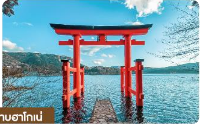
ล่องเรือทะเลสาบฮาโกเน่

ห้องที่เข้าไปกับเรือฮาโกเน่ เสมือนการผจญภัยในโลกแห่งโจรสลัด เมื่อพูดถึงการเที่ยวชมทะเลสาบฮาโกเน่ สิ่งแรกที่ทำให้ผู้คนหลงใหลคงจะเป็น เรือฮาโกเน่ ที่มีลักษณะคล้ายเรือโจรสลัดโบราณที่เต็มไปด้วยสีสนและสไตรล์อันยุค การล่องเรือในทะเลสาบฮาโกเน่จะพาคุณไปสัมผัสกับวิวทิวทัศน์ที่งดงามสุดๆ ของภูเขาฟูจิที่อยู่ในระยะไกล และธรรมชาติที่อุดมสมบูรณ์รอบๆ ทะเลสาบที่เปลี่ยนแปลงไปตามฤดูกาล ในช่วงฤดูใบไม้ผลิและฤดูใบไม้ร่วง ทะเลสาบฮาโกเน่จะเต็มไปด้วยสีสนของดอกไม้และใบไม้ที่หลากหลายนับเป็นภาพที่ตื่นตาตื่นใจสุดๆ ที่จะช่วยให้คุณรู้สึกเหมือนหลุดเข้าไปในภาพวาดของธรรมชาติ จากนั้น.. นำพาทุกท่านเข้าสู่