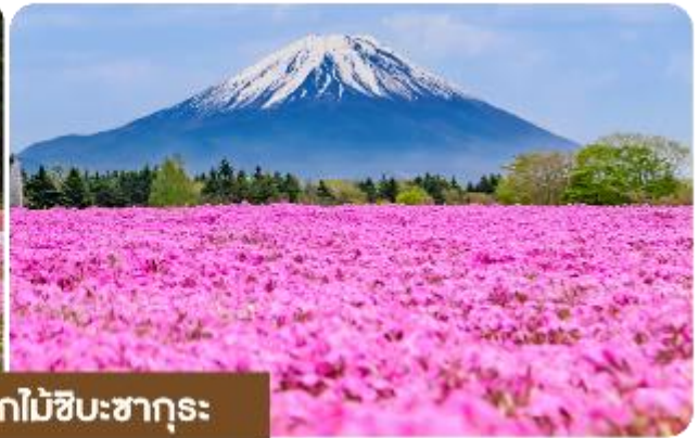
เทศกาลชมดอกไม้ชิบะซากุระ

เทศกาลชมดอกไม้ชิบะซากุระ (Shibazakura Festival) เป็นเทศกาลที่จัดขึ้นในช่วงฤดูใบไม้ผลิ เดือนเมษายนถึงพฤษภาคม โดยที่มีการจัดแสดงดอกชิบะซากุระ (หรือที่เรียกว่า "ดอกไม้มอส") ที่บานเต็มทุ่งหญ้า ดอกชิบะซากุระจะมีสีสันหลากหลาย เช่น สีชมพู ม่วง ขาว และแดง ซึ่งถือเป็นไฮไลท์ของในช่วงเทศกาลนี้ และจะได้เห็นทุ่งดอกไม้ที่กว้างขวางที่เรียงรายไปตามเนินเขาบรรยากาศที่สวยงามพร้อมกิจกรรมต่าง ๆ ให้ผู้เข้าชมได้เพลิดเพลิน เช่น การเดินเล่นในสวน ถ่ายรูป และการเพลิดเพลินกับวิวทิวทัศน์ที่สวยงามของภูเขาและธรรมชาติ