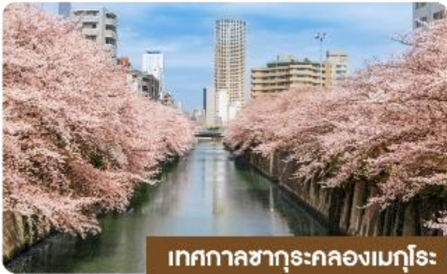
เทศกาลซากุระคลองเมกูโระ | สตาร์บัคส์ใหญ่ที่สุดในโลก

ตลาดปลาซึกิจิ Tsukiji Outer Market ตลาดปลาที่มีชื่อเสียงของญี่ปุ่น และยังเป็นหนึ่งในตลาดปลาที่ใหญ่ที่สุดในโลกด้วยค่ะ ตั้งอยู่ในโตเกียว ตลาดแห่งนี้มีการซื้อขายอาหารทะเลมากกว่า 2,000 ตันต่อวัน โดยโซนภายในตลาดนั้นจะแบ่งออกเป็น 2 ส่วน ก็คือ ส่วนด้านนอก ที่มีร้านค้าปลีกและร้านอาหารอยู่เรียงรายให้เราได้เลือกซื้ออาหารทะเลสด ๆ รับประทานกัน