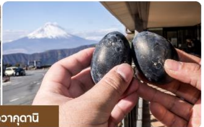
หุบเขาไข่ดำโอวาคุดานิ

โอวาคุดานิ (Owakudani) คือหนึ่งในสถานที่ที่ต้องไปเยือนหากมีโอกาสไปเที่ยวญี่ปุ่น ซึ่งที่นี่เต็มไปด้วยไอน้ำร้อนและกลิ่นกำมะถันที่พวยพุ่งออกมาจากพื้นดิน ล้อมรอบด้วยภูเขาไฟฟูจิที่งดงาม สิ่งที่คุณพลาดไม่ได้คือ...ไข่ดำเมนูที่คุณต้องลอง วิธีการทำไข่ดำคือการต้มไข่ในน้ำร้อนที่มีซัลเฟอร์สูง เมื่อไข่เสร็จแล้วเปลือกจะกลายเป็นสีดำ เชื่อกันว่าหากทานไข่ดำ 1 ฟอง จะช่วยเพิ่มอายุขัยให้กับคุณได้ถึง 7 ปีสิ่งที่ไม่พลาด เดินชมวิวที่โอวาคุดานิ และเก็บภาพภูเขาฟูจิ ทานไข่ดำลองสัมผัสรสชาติที่แตกต่าง เดินทางด้วยกระเช้าลอยฟ้าจากสถานีฮาโกเน่ เพื่อชมทิวทัศน์อันงดงาม