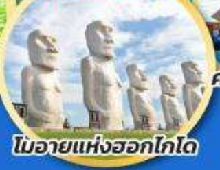
โมอายแห่งฮอกไกโด