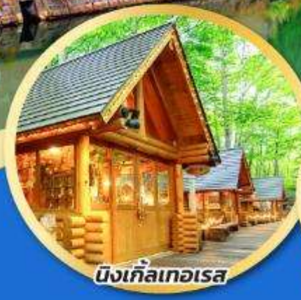
บึงเกลือเทอเรส