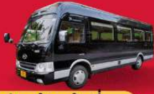
BUS (10-18 ท่าน)