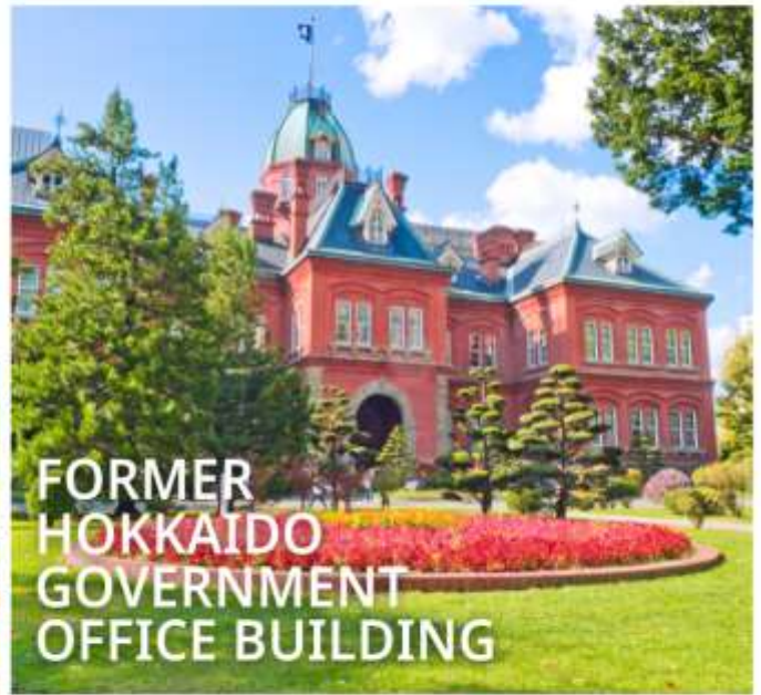
FORMER HOKKAIDO GOVERNMENT OFFICE BUILDING

เป็นตึกสไตล์นีโอบารอก มีลักษณะพิเศษที่มีหลังคายอดแหลมและกรอบหน้าต่างเป็นเอกลักษณ์ เปรียบเสมือนอนุสาวรีย์การบุกเบิกของฮอกไกโด ปัจจุบันได้รับการขึ้นทะเบียนเป็นมรดกทางวัฒนธรรมของชาติ